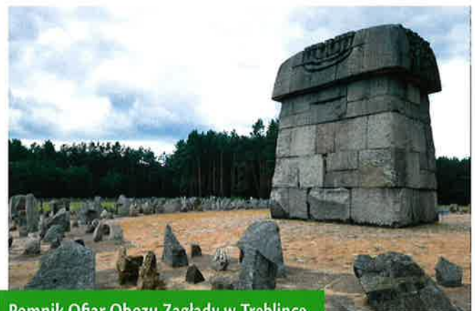
Pomnik Ofiar Obozu Zagłady w Treblince.