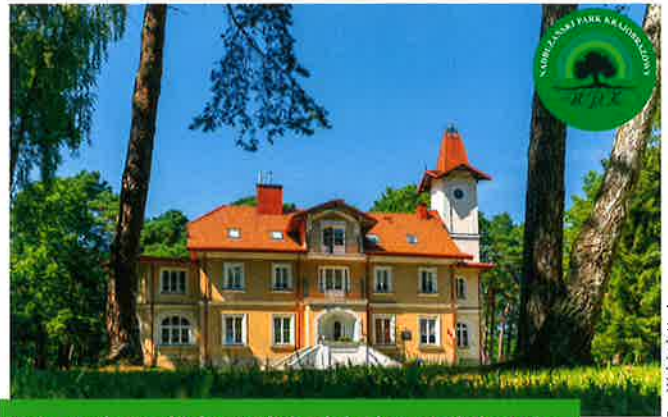
Pałac Paderewskich w Kaliskach będący siedzibą NPK.

W rejonie Parku znajduje się również mnóstwo skarbów historii, m.in. zamek w Liwie, pałace w Starejwsji, Korczewie, Sterdyni, Ceranowie i Łochowie. Oprócz tego na jego obszarze położone jest Muzeum Treblinka, które zostało utworzone na