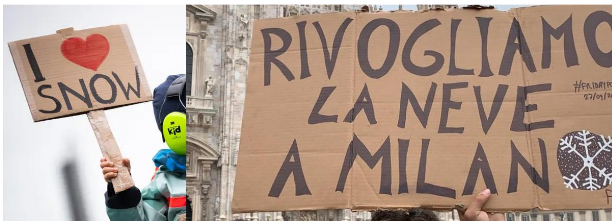
Źródła zdjęć: https://samijewellery.com/blogs/news/a-round-up-of-our-favourite-global-climate-strike-signs https://www.open.online/2019/09/27/fridays-for-future-in-150-citta-italiane-le-manifestazioni-per-lo-sciopero-del-clima/

Młodzieżowy Strajk Klimatyczny to ogólnoswiatowy ruch, gdzie młodzi ludzie i uczniowie strajkują, aby pokazać dorosłym, że niewystarczająco zajmujemy się ochroną klimatu.