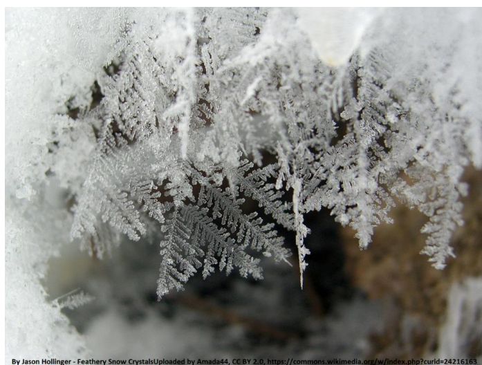
By Jason Hollinger - Feathery Snow CrystalsUploaded by Amada44, CC BY 2.0, https://commons.wikimedia.org/w/index.php?curid=24216163

Uzupełnijcie, na czym polega proces nazywany RESUBLIMACJĄ .