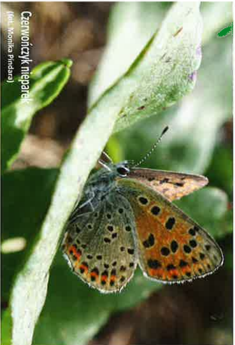
Czerwińczyk nieparek